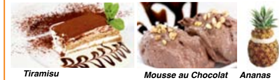
Tiramisu Mousse au Chocolat Ananas