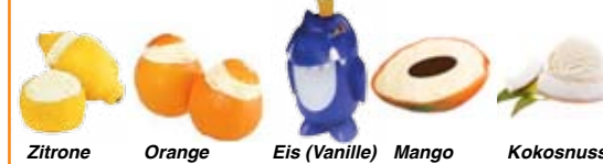
Zitrone Orange Eis (Vanille) Mango Kokosnuss